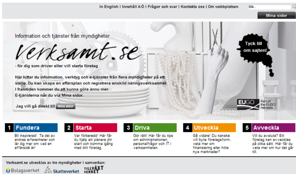
Figur 1. Startsidan för www.verksamt.se

Ett blomstrande näringsliv är en förutsättning för samhällslivet i övrigt. Staten och kommunerna gör därför många insatser för att underlätta och förenkla att företag startas, drivs och utvecklas. Informationstekniken spelar här, liksom inom många andra områden, en allt viktigare roll. Ett exempel på detta är den statliga företagsajten verksam.se. Bakom denna webbplats står tre myndigheter: Tillväxtverket, Bolagsverket och Skatteverket. En idé bakom verksam.se är att på ett ställe samla information, tjänster och andra hjälpmedel som företag kan ha behov av. Verksam.se är i drift och utvecklas kontinuerligt. Titta in på sajten och skaffa dig en egen uppfattning: www.verksamt.se